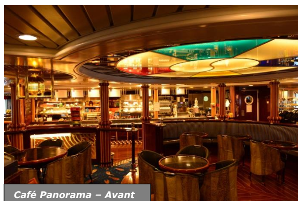
Café Panorama – Avant

Le bar sera déplacé vers le pont panoramique et sur le pont arrière extérieur, des espaces barbecues seront ajoutés.