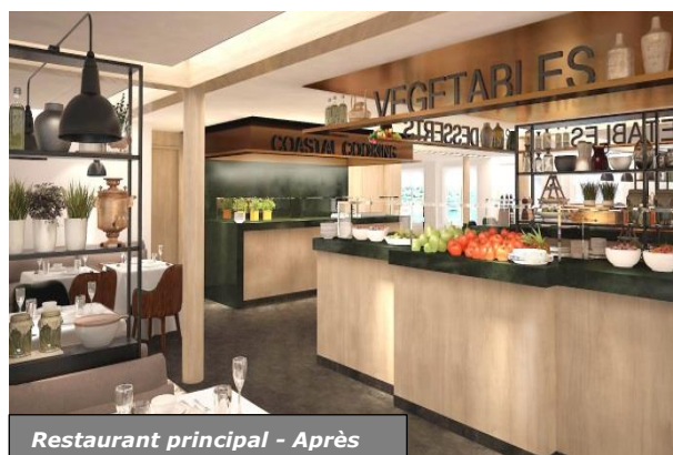
Restaurant principal - Après