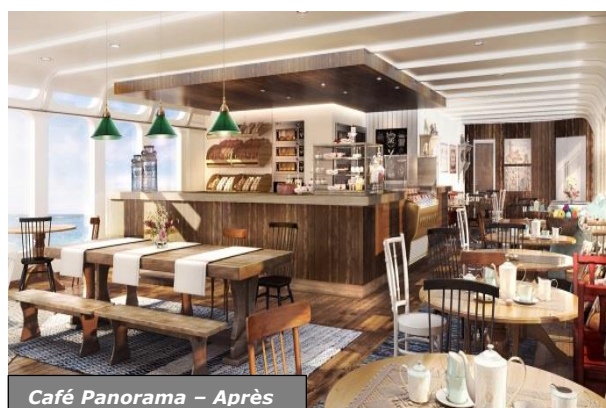
Café Panorama – Après