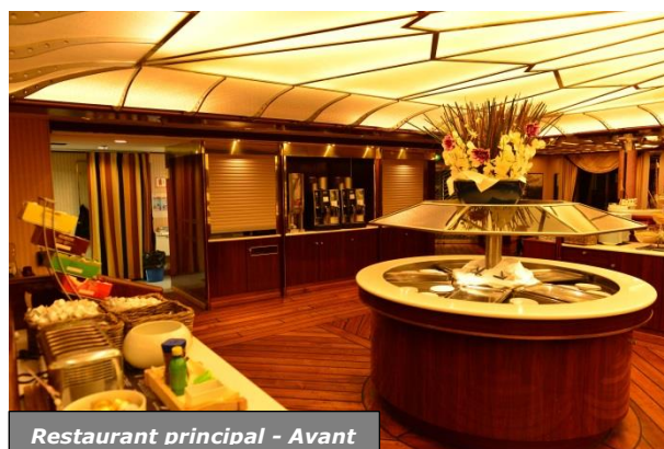
Restaurant principal - Avant